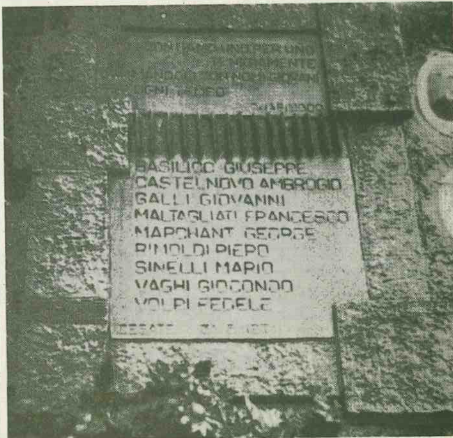
Targa a ricordo dei caduti di Cesate (MI) posta dietro al monumento di Mauthausen